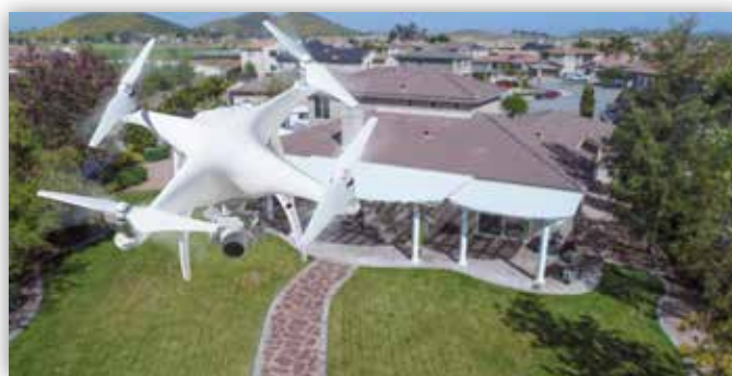
Hochwertige Luftbilder mittels Drohnenaufnahmen

Diesen Einblick in die Immobilie stellen wir ausschließlich qualifizierten Kunden zur Verfügung, welche sich vorher bei uns registrieren müssen um die Privatsphäre der aktuellen Bewohner zu wahren und sogenannten „Besichtigungstourismus“ zu vermeiden. Auch ist es uns möglich, intime Details der Wohnungen wie z.B. Familienfotos, Standort vom Schlüsselkasten usw. unkenntlich zu machen. Die reale Vor-Ort-Besichtigung findet dann nur noch mit den Kunden statt, welche bereits wirklich gesteigertes Kauf- / Mietinteresse haben.