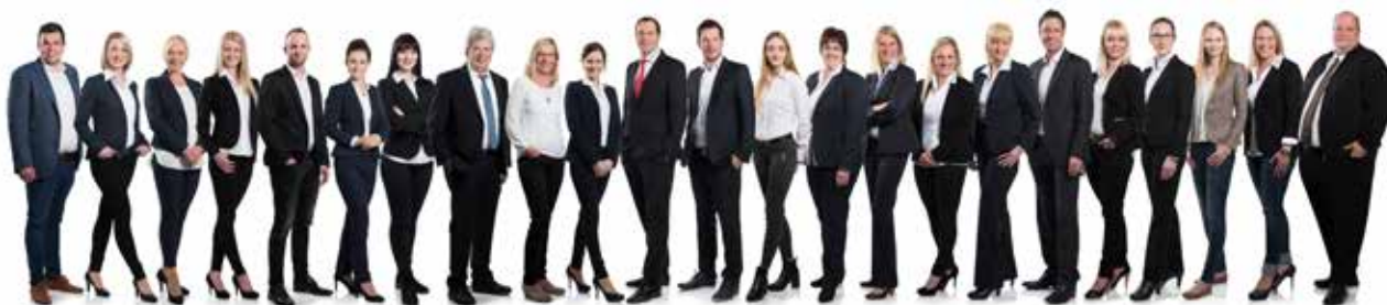
Das Team von Mayer & Dau Immobilien

Als alteingesessenes Immobilienunternehmen, welches weit über die Grenzen des Nordwestens bekannt ist, wird Mayer & Dau von seinen Kunden für die fachkundige Beratung sowie die individuelle Betreuung durch ausgebildete Mitarbeiter geschätzt. Schwerpunkte der Firma Mayer & Dau Immobilien liegen beim Verkauf und der Vermietung von Immobilien jeglicher Art sowie der Erstellung von Gutachten